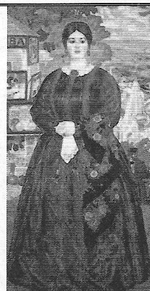
2. "Кунчиха" В. М. Вукобратов XIV-XV вв.