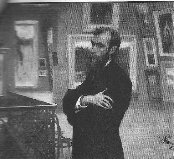
И. Репин, "Портрет Стрельцова" 1883 г. 38