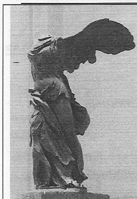
1. Скульптура "Венус из Виллендорфа" 1863 г. Шарль Шампурзо