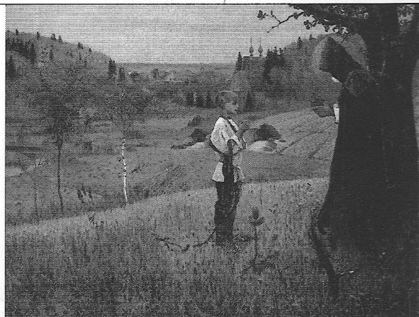
6. Устюгов В. В. "Видение Божьей Варвара", 1890 г. 35