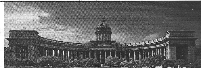
8. Казанский собор. В Санкт-Петербурге Михаил Замцов, 1733 г.