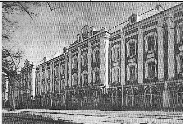
7. Здание Великолепной Александры и ее окружение, 1722 г. 36 Доменико Трезини и Яков Кивертс