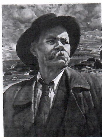
5. М. Горький ✓