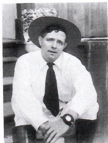
4. Джек Лондон ✓