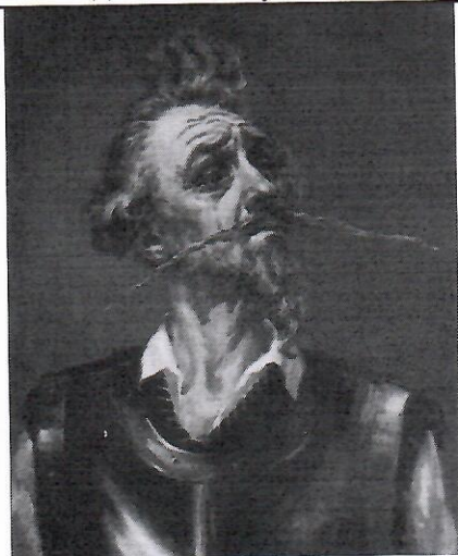
1. дон Кихот ✓