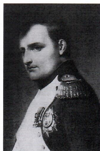
3. Наполеон +