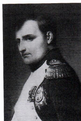
3. Наполеон ✓